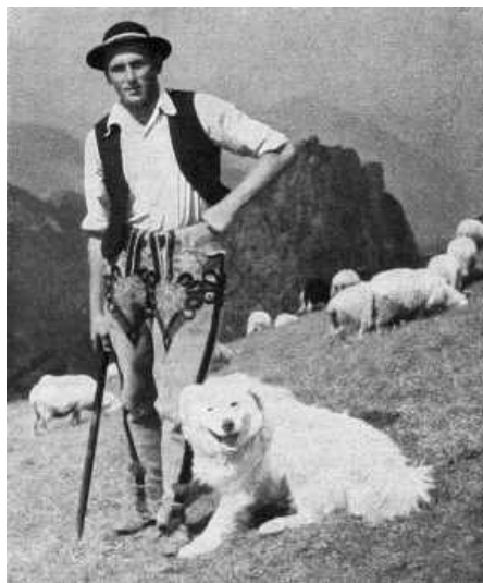
Gorale mit Hirtenhund und Schafen in der Tatra. Während im tschechoslowakischen Nationalpark in der Tatra die Almwirtschaft abgeschafft wurde, stiegen nach 1945 die Schafherden im polnischen Teil stark an.

Deutlich wird auch hier die Entwicklung der Hirtentraditionen seit dem 19. Jahrhundert, in dem größtenteils die Hutweiden Ungarns in Ackerland verwandelt wurden. Nachfrage regelt das Angebot - und so ist es den ungarischen Hirtenhunden genauso ergangen wie vielen anderen: sie wurden von der Pußta in die Dörfer gebracht und hüteten als Kettenhunde die Häuser. Der zweite Weltkrieg tat sein übriges und ließ die Population dieser Hunde in ihrem Ursprungsland zusammenschmelzen. Da es in den Dörfern und Städten wenig Verständnis für die neue Zucht der Hirtenhunde gab, ist es als Glück anzusehen, daß sich europaweit viele verantwortungsvolle Züchter um den Erhalt dieser Rassen verdient gemacht haben.