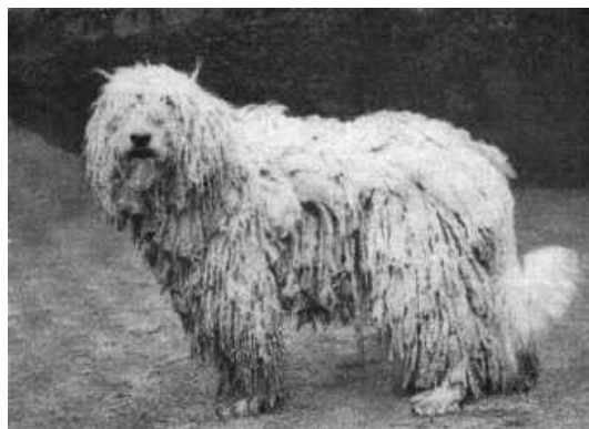
Komondorhündin „Bajos“ MET. 228, KuZ. 283, gew. 14. V. 1934, aus Ungarn importiert. Bes. Hildegard Böhne, Oybin; Aufn. Dr. Erna Mohr, Oybin IX. 1938 Foto: Die Neue Brehm-Bücherei

Die Einleitung erklärt dem Leser den Unterschied zwischen Hüte- und Hirtenhunden und begründet bei zweitgenannten auch gleich die Ähnlichkeit des Aussehens der vielen Rassen, nämlich: " Gleicher Zweck schafft gleichen Typ. "