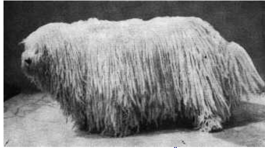
Komondorrüde „Boytar von den Hohen Ähren“ KoZ 425, gew. 22.VII. 1947, 7 Jahre alt in vollendeter Schnürenbehaarung; Z. Marion Huth, Berlin; Bes. Wilhelm Pohlmann, Oberursel/Taunus; Aufn. Dr. Erna Mohr, Frankfurt a. Main 9. V. 1954 Foto: Die Neue Brehm-Bücherei

Ab Seite 87 sind detaillierte und mit mehreren Diagrammen, Skizzen und Tabellen versehene Ausführungen zum Haarkleid, Geschlechts- und Zuchtreife, Geburts- und Aufzuchtsgewichte, Wurfstärke- und Geschlechtsproportionen, Bewegungsweisen und Hundegebiß anzusehen.