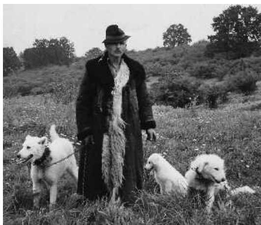
Schaffhirt mit Kuvasz auf der Deliblatér Sandsteppe. Die erwachsenen Hunde tragen am Hals ein Stachelband als Schutz gegen Wolfsbisse. Aufn. Dr. Antal Festetics, 1966 Foto: Die Neue Brehm-Bücherei

Damit sind wir auch schon bei den verwandten Rassen - diese werden ab Seite 63 vorgestellt, namentlich die Weißen. Im Text finden sich Erklärungen über die Verwandtschaft der Hunde nördlich und südlich der Tatra und was es mit den Goralenhunden - Liptaki - auf sich hat. All diese Verwandtschaften hier zu schildern, würde den Rahmen dieser Buchbesprechung sprengen, daher nur dieses kurze Zitat: