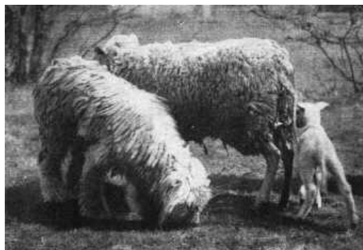
Komondorrüde „Elijen von Akjos“ KoZ. 441, gew. 17. II.1949; Z. Helene Sojka, Berlin; Bes. Walter Hansen, Hamburg-Schnelsen. – 26 Monate alt, noch unfertig im Haar, mit den Schafen auf der Weide. Aufn. Dr. Erna Mohr, VI. 1951

Nun ja, Schafe gibt es in vielen Farben, und selbst weiße sehen im Alltag eher steingrau oder sandfarben aus. Jedenfalls wird Weiß als "Hauptfarbe" des Haarkleides der Hirtenhunde angegeben. Ab Seite 106 wird die weiße Fellfarbe noch einmal ganz detailliert unter die Lupe genommen.